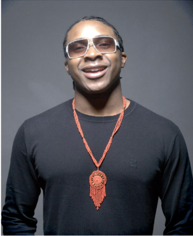
エイミー・ワインハウスのピアニスト、アース・ウィンド&ファイアーのプロデューサーを務めるなど、多才な顔を持つザントーン・ブラックは、シンガー・ソングライターとしても、80年代のファンク・ソウルをベースにワールド...